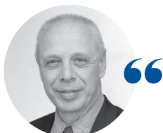
Jean-Paul WYSS Président du tribunal administratif de Grenoble

Le tribunal administratif de Grenoble s'est prononcé en 2020 sur des enjeux majeurs de société : sur des questions d'environnement, notamment en statuant sur la responsabilité de l'État à raison de la pollution de la vallée de l'Arve ou sur la légalité d'arrêtés municipaux interdisant l'épandage de pesticides, sur des questions de démocratie locale liées au contentieux des élections municipales dont il a été saisi de manière plus abondante que lors des scrutins précédents et, bien sûr, sur des litiges relatifs à la mise en œuvre des mesures sanitaires, comme la fermeture des parcs et jardins ou de certains commerces et des salles de sport qui ont donné lieu à plusieurs décisions remarquées, particulièrement en référé. Premier tribunal administratif de